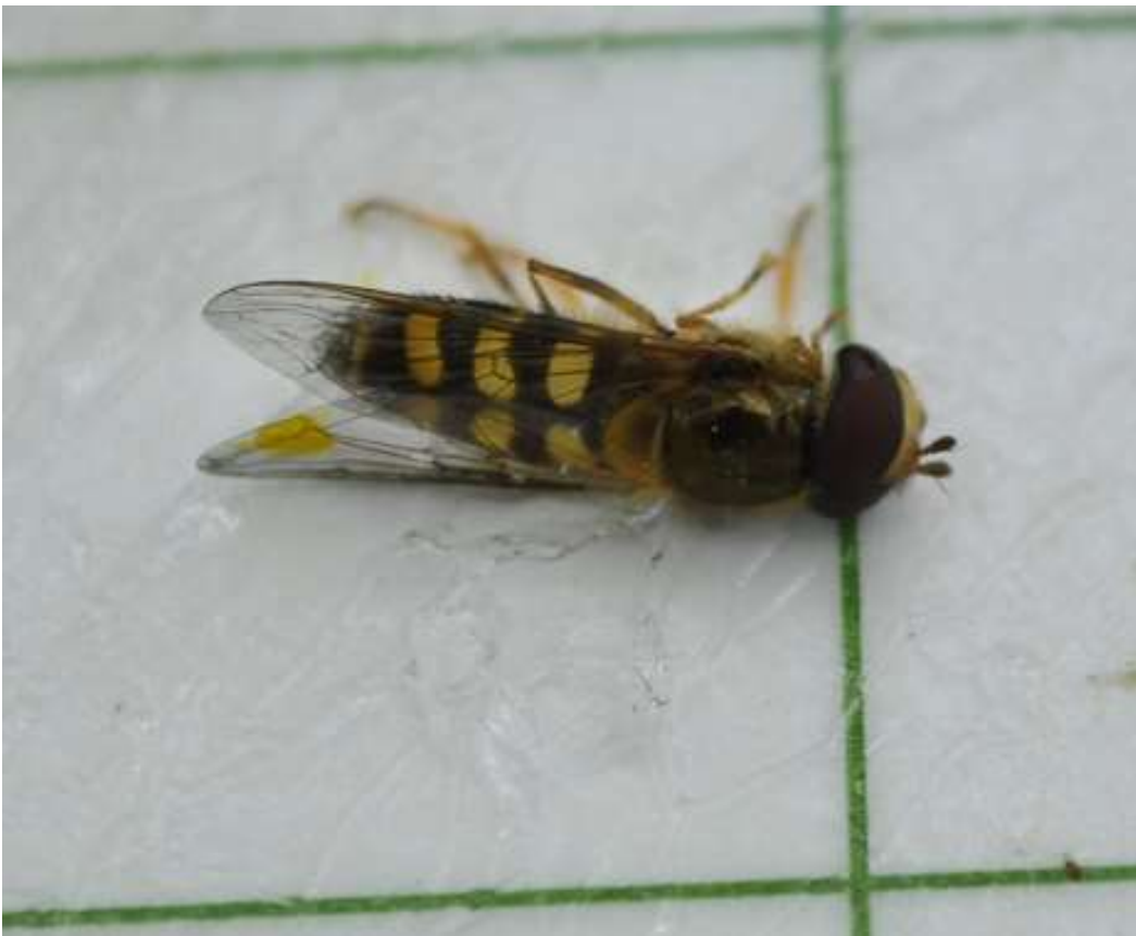
Syrphe ribesii sur le fond englué.