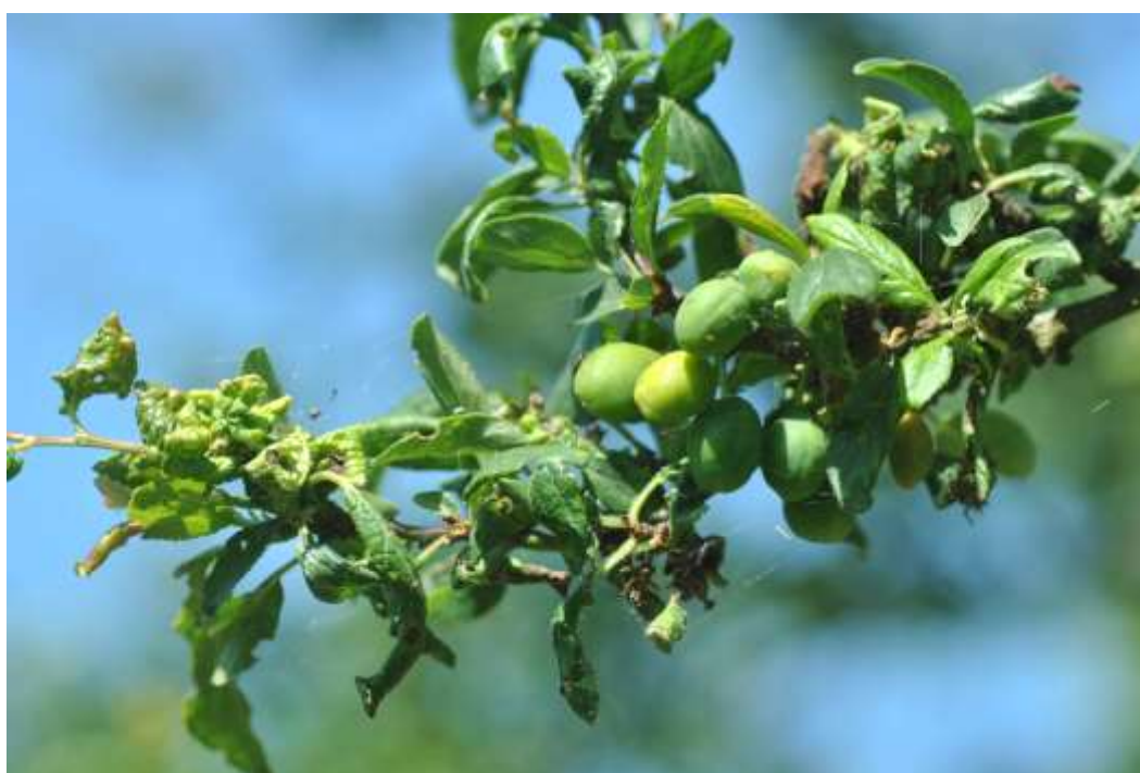
Nouaison de mirabelles et dégâts de pucerons sur les jeunes pousses.