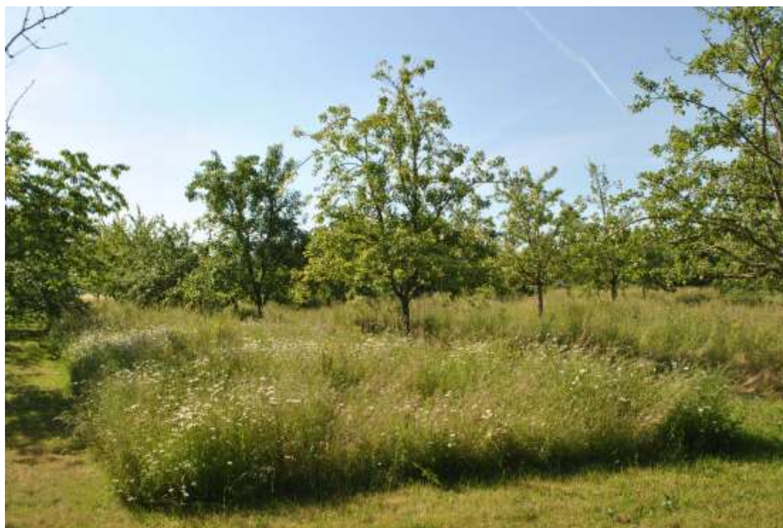
Le Verger au 02 juin.

Remarque : J'observe que de nombreux syrphes, essentiellement des syrphes ceinturé et des syrphes ribesii se font prendre sur les fonds englués !! 8 au total sur les 4 pièges !