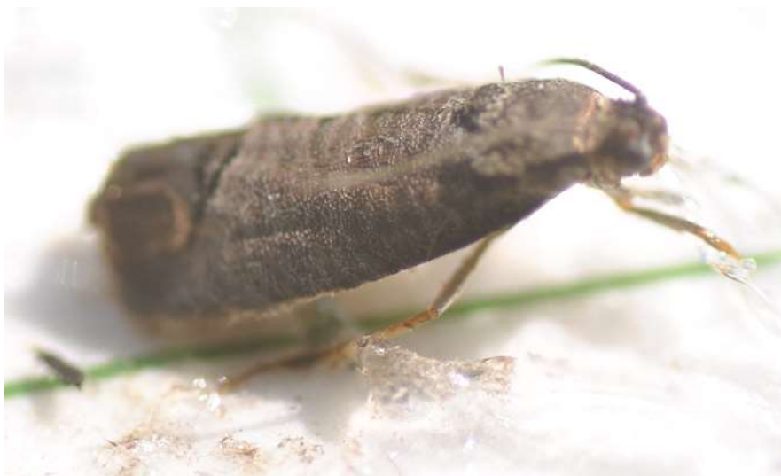
Carpocapse sur fond englué.