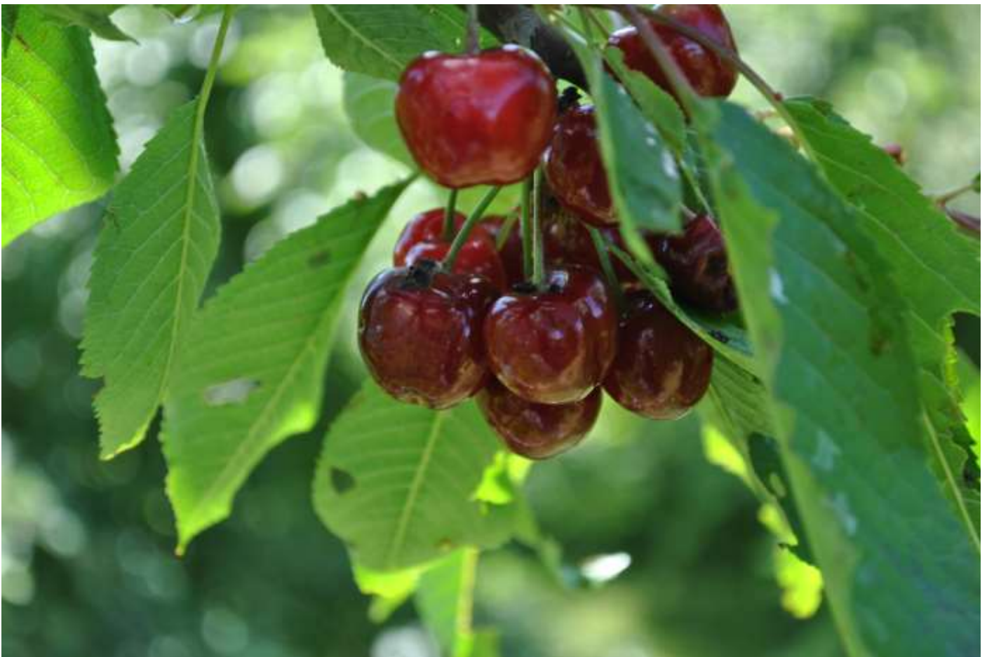
Cerises 'Burlat' à maturité au 02 juin.