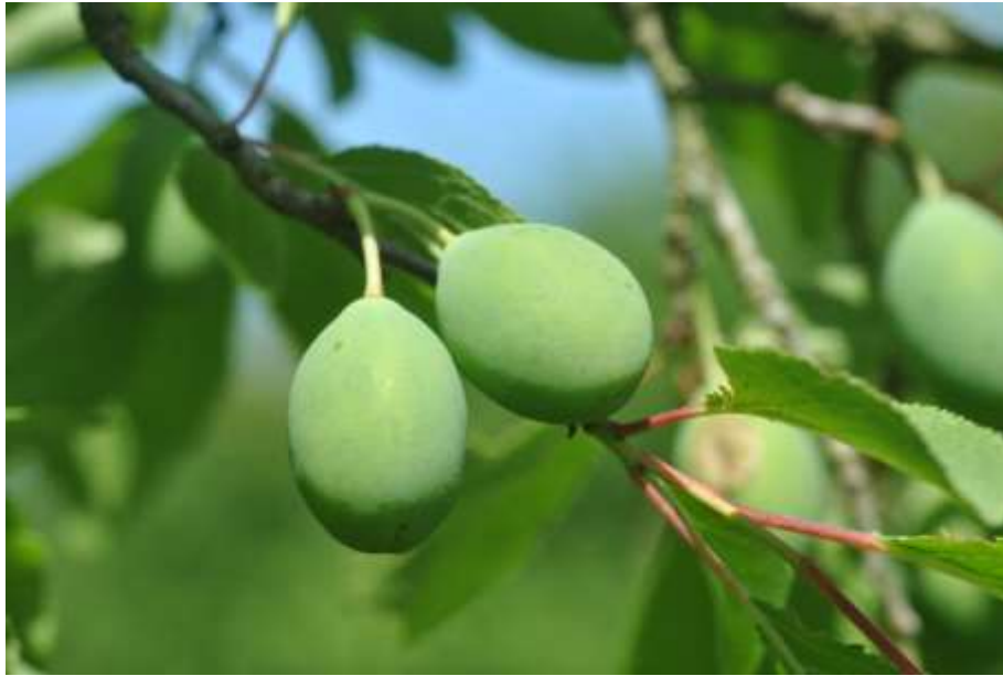
Nouaison de prune 'Coco Jaune'